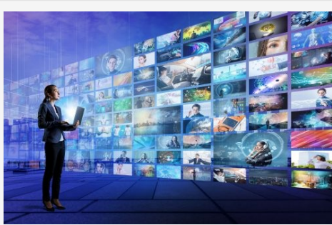
Die Sender-Auswahl beim Internet-Fernsehen ist nahezu unerschöpflich.

Einer der größten Vorteile des Internet-TV gegenüber dem herkömmlichen Fernsehen ist das „ Timeshifting “: Damit entfällt ab sofort die Pausenpause während der Werbung, denn das Programm kann jederzeit angehalten und zu einem späteren Zeitpunkt weitergeschaut werden . Ein weiterer Pluspunkt: TV-Archive und Bibliotheken machen den Videorekorder überflüssig und spielen Ihre Lieblingssendungen und Serien auf Knopfdruck ab. Sogar Zuschauer von Nischensendern kommen auf ihre Kosten, denn in der großen Programmviefalt im Internet ist für jeden Geschmack genau das richtige dabei .