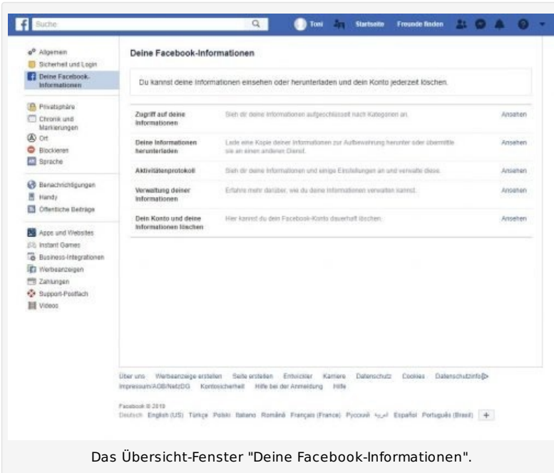
Das Übersicht-Fenster "Deine Facebook-Informationen".

Klicken Sie auf den Button „Ansehen“ bei „Dein Konto und deine Informationen löschen“ um zum Auswahlfenster für die Konto-Löschung zu gelangen.