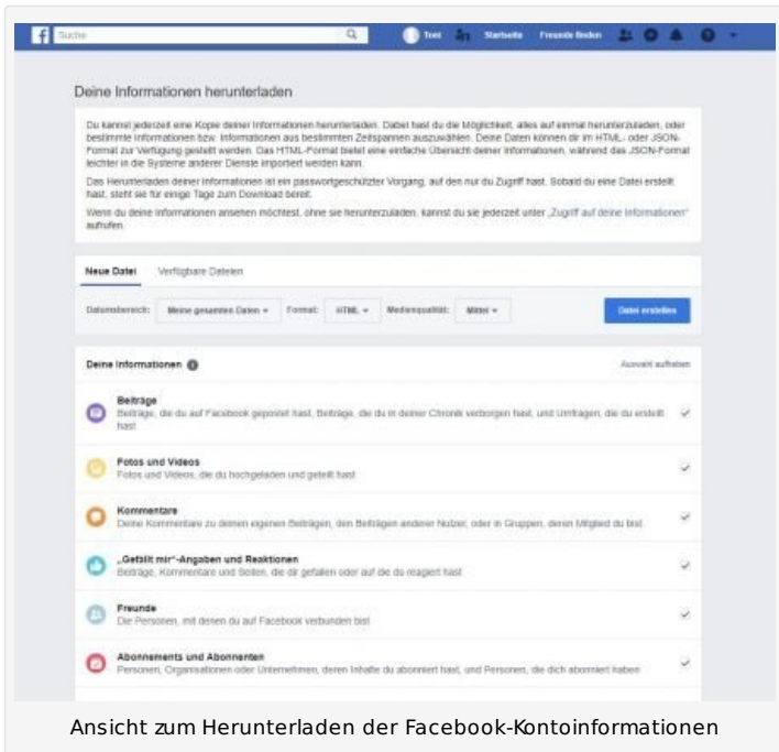
Ansicht zum Herunterladen der Facebook-Kontoinformationen